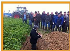
Diagnostic du sol

Pour compléter et faciliter la conduite du semi, Actisol a créé le module Strip Sol. Celui-ci est composé d'éléments complémentaires associés sur un support trapézoïdal.