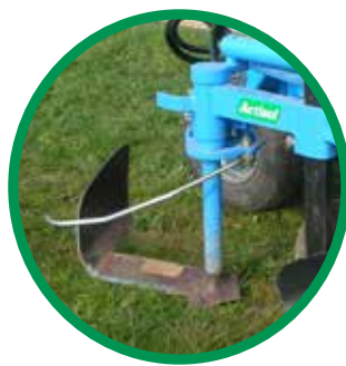
ACTICEP HYDROLAME AVEC LAME DÉCAVILLONNEUSE