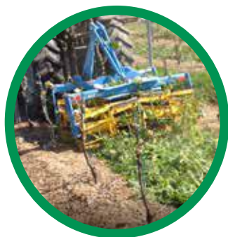
DESTRUCTION COUVERTS VÉGÉTAUX ROLL KROP