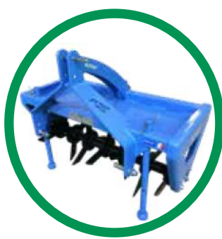
AÉRATION ENHERBEMENT ACTIFLORE