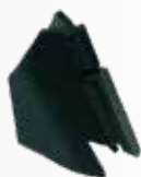
Nez de protection