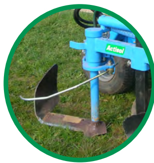
ACTICEP HYDROLAME AVEC LAME DÉCAVAILLONNEUSE