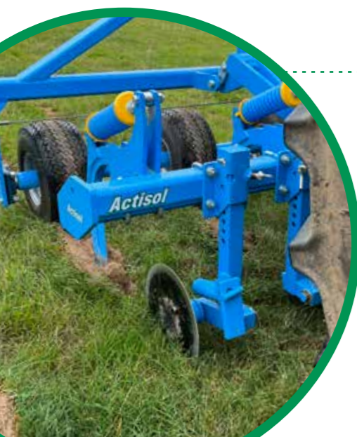
Sabot de fissuration