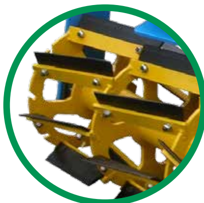
ROULEAU À LAMES