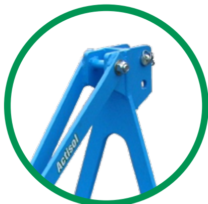
BÂTI 3 POINTS