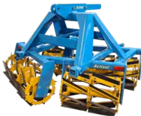
Roll Krop Arbo